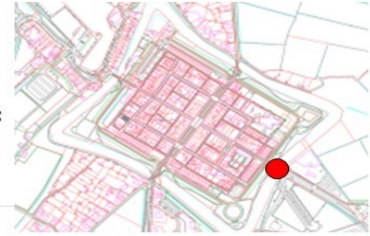
Zwolscheweg ingang stad: